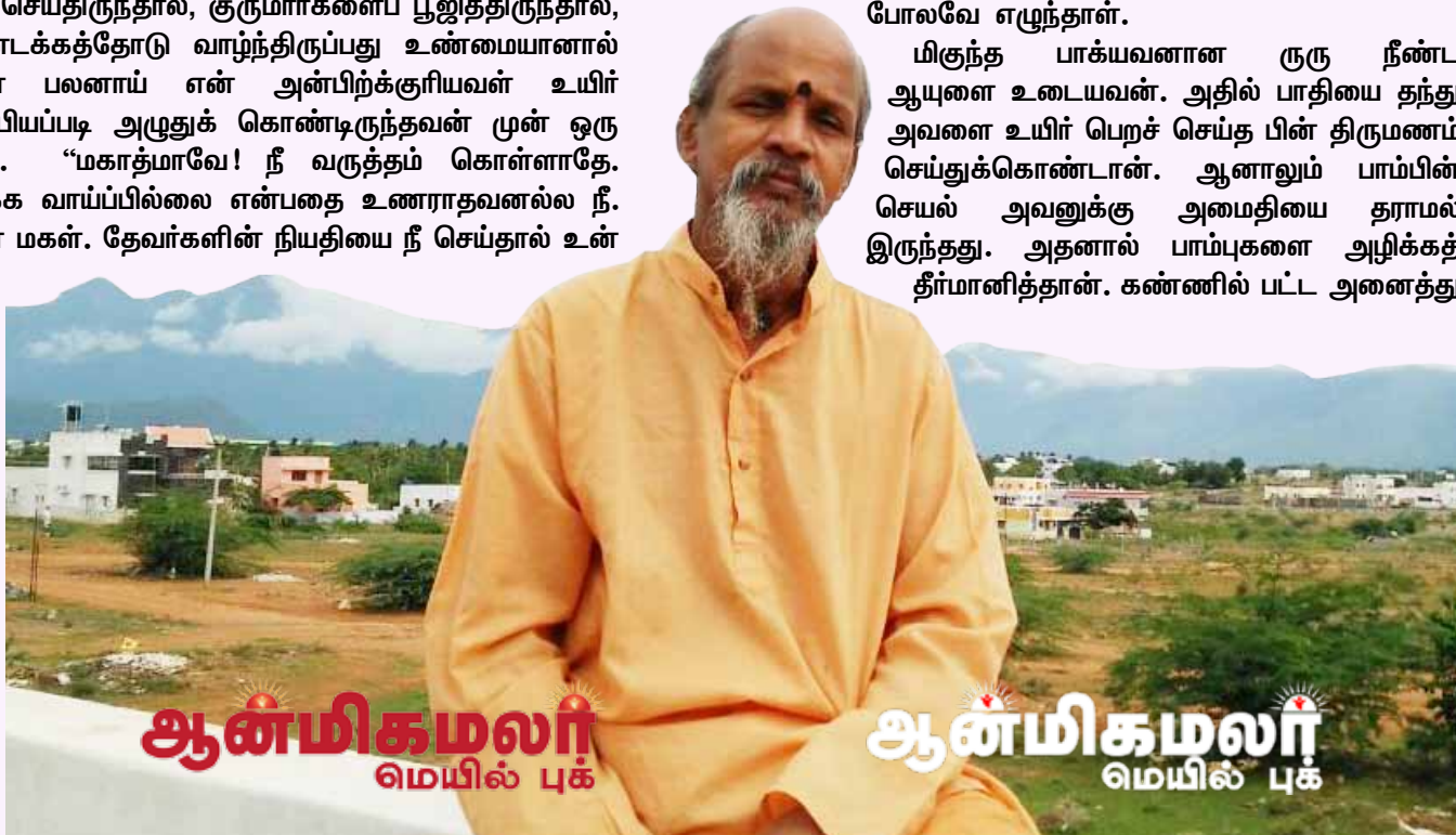
ஆன்மிகமலர் மெயில் புக

உடனே ருரு “தேவனே! அந்த வழியை உடனடியாக கூறு. நான் அதை நிச்சயம் செய்வேன். எனக்கு இந்த உதவியை செய்” என்றதும் “உன் ஆயுளில் பாதியை நீ தந்தால் அவள் உயிர் பிழைப்பாள்” என்றான்