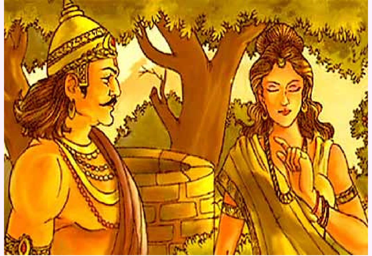
ஆன்மிகமலர் மெயில் புக

தேவதூதன். “நான் அப்படியே செய்கிறேன் அவள் முன்பு இருந்தது போலவே அழகோடு எழுந்து வரட்டும்” என்று ருருவும் ஒப்புக் கொண்டான்.